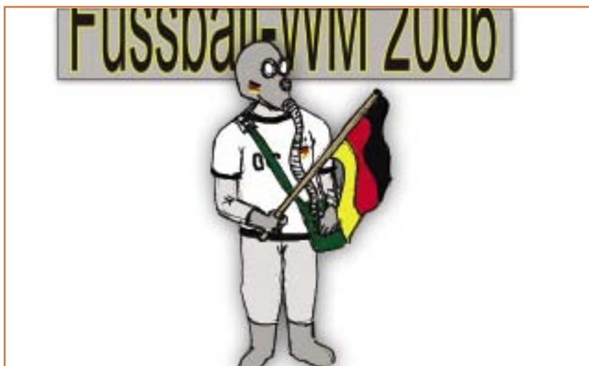
Illustration: Jörn Amelung © 2006

Wir lassen uns doch nicht den Spass verderben!